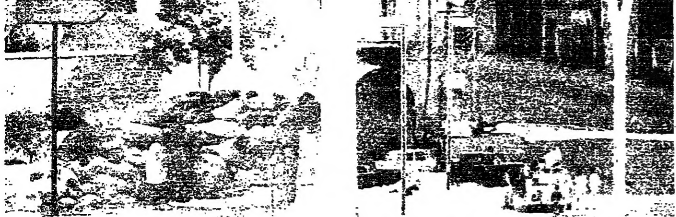
مسلحون وراء مراس في بيروت امس